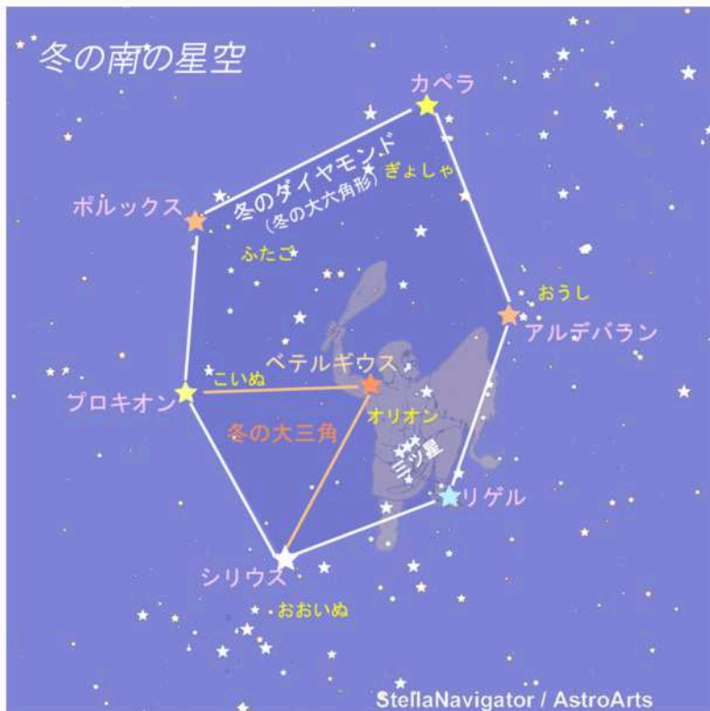
StellaNavigator / AstroArts